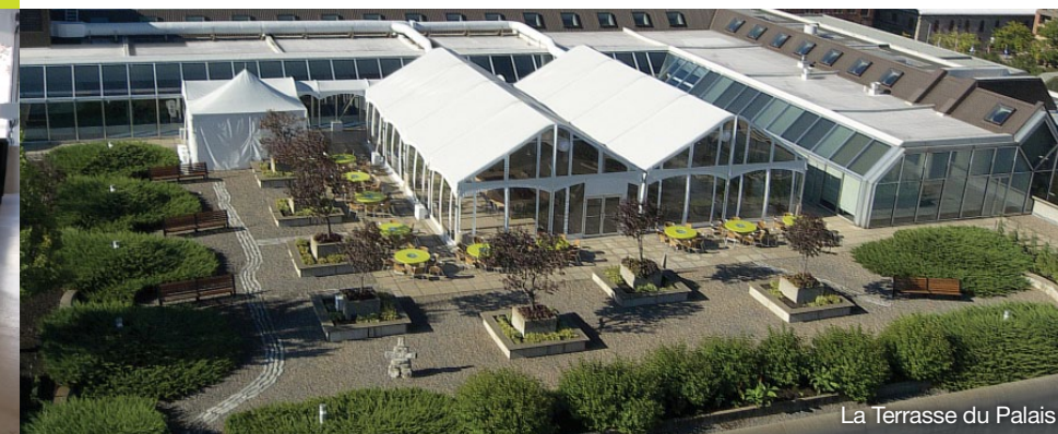
La Terrasse du Palais