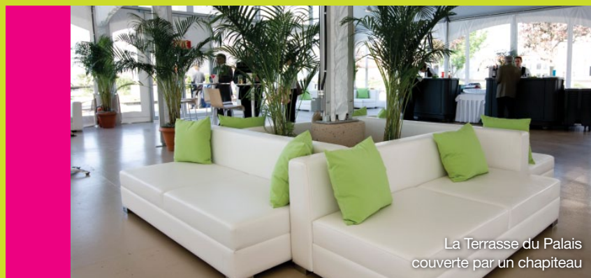
La Terrasse du Palais couverte par un chapiteau